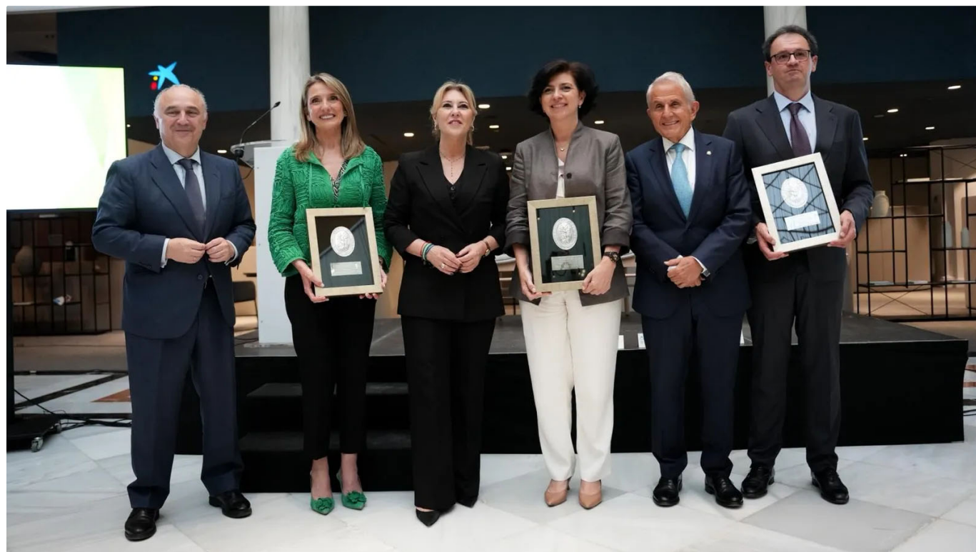
Foto de familia de la sexta edición de los Premios 'Francisco de Asís', organizados en la oficina Store Sierpes de CaixaBank en Sevilla.

↳ CaixaBank y la Academia de Ciencias Sociales y Medio Ambiente renuevan su compromiso con la sostenibilidad