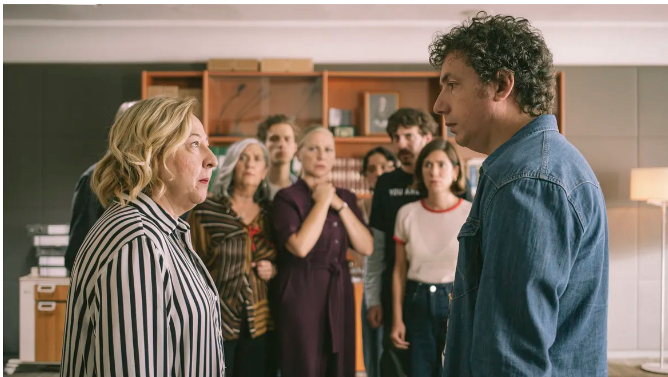
Nueve cuñados sin piedad