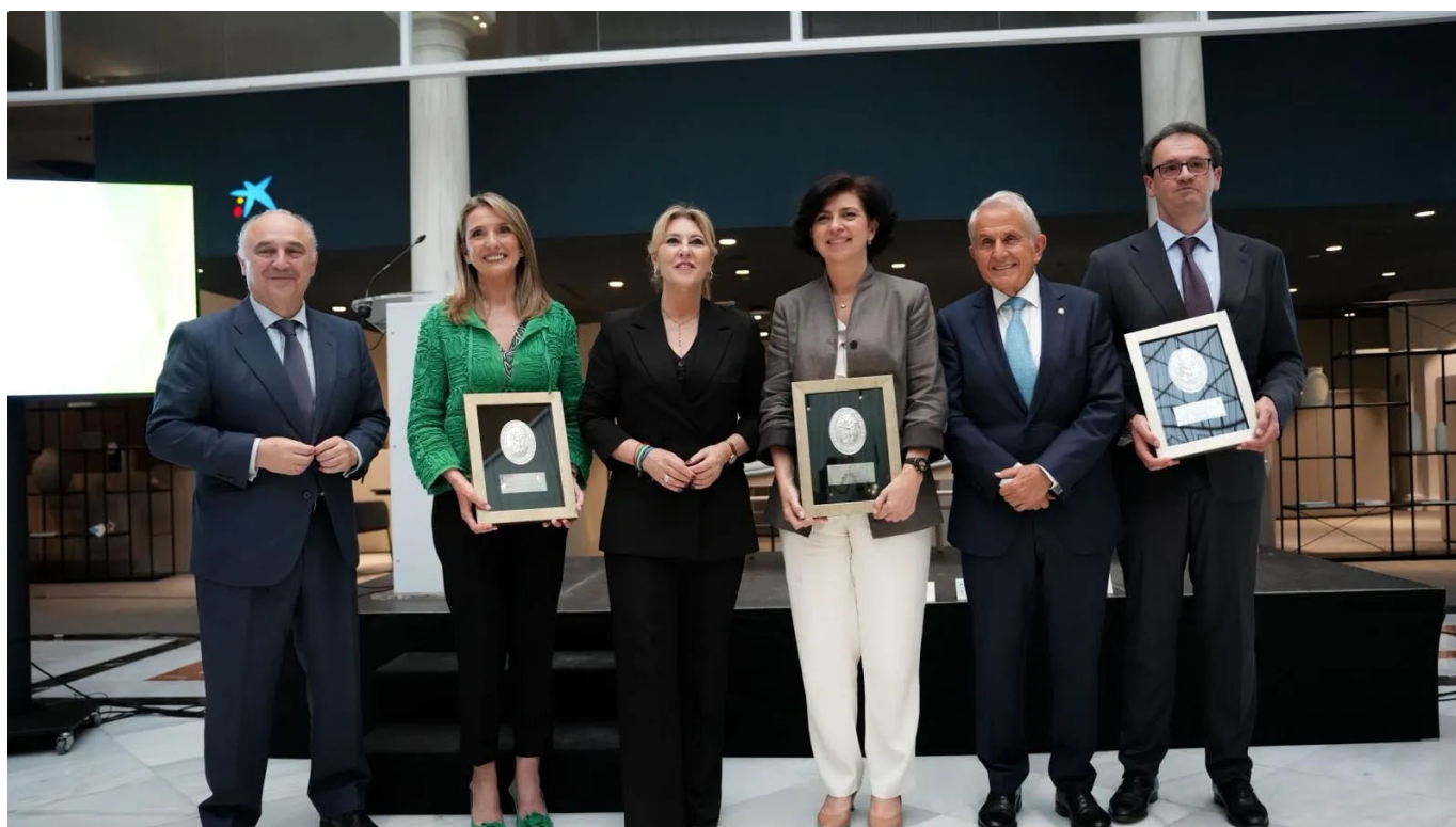
Foto de familia de la sexta edición de los Premios 'Francisco de Asís', organizados en la oficina Store Sierpes de CaixaBank en Sevilla.

↳ Atlantic Copper pondrá en marcha Circular entre el segundo y el tercer trimestre de 2026