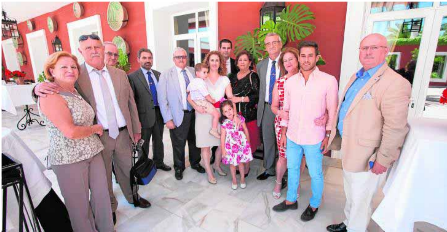
Algunos de los participantes en el almuerzo homenaje al comisario jefe provincial, en el centro.