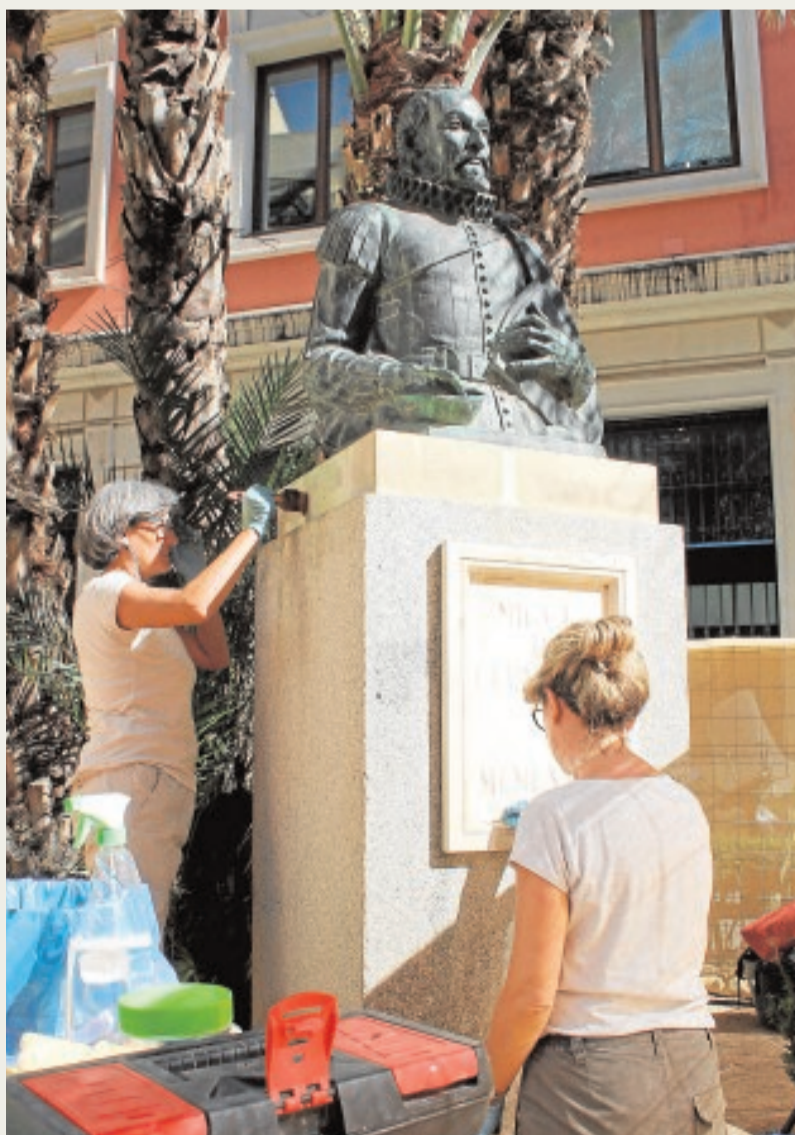
Operarias trabajan, ayer, sobre el monumento