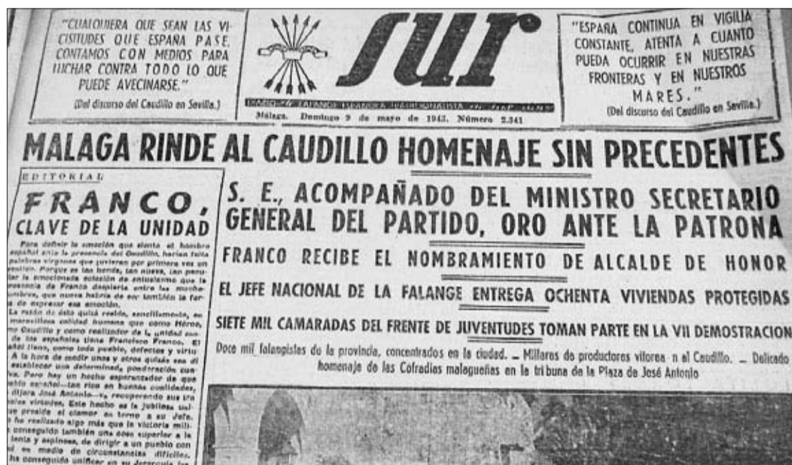
Portada del diario Sur que anuncia el nombramiento de alcalde de honor a Franco. LA OPINIÓN

El concejal del PSOE Daniel Pérez explicaba ayer que la tarifa del BOP es de 0,29 céntimos por palabras y que además existen descuentos para anuncios de menos de 500 palabras o que se presenten por correo electrónico o por soporte magnético, por lo que un texto con el anuncio de la retirada de las distinciones a Franco no debería tener más de cien palabras y costar unos 29 euros, «lo que esta-