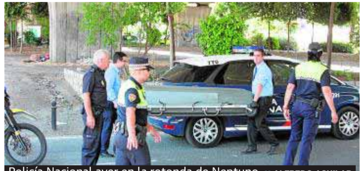
Policía Nacional ayer en la rotonda de Neptuno.