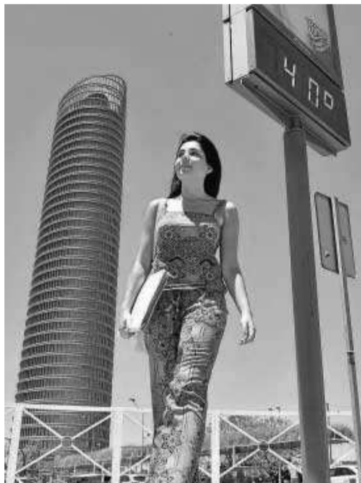
Un termómetro en Puerta Triana marcaba ayer 40 grados.

Este año, la Agencia Estatal de Meteorología (Aemet) no prevé unos registros tan altos como los del pasado año para los próximos días. Esta semana los termómetros se mantendrán en torno a los 36 y 37 grados hasta el sábado. El domingo, la Aemet pronostica un leve descenso de las temperaturas, con máximas de 32 grados. Este descenso será sólo por ese día, ya que el lunes, la última semana del mes, aumentarán de nuevo las máximas hasta cinco grados, según los datos de Aemet. En concreto, se esperan temperaturas mínimas en des-