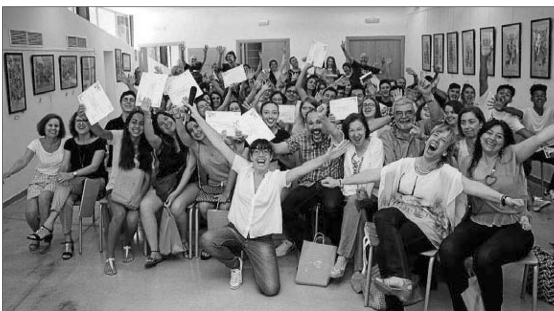
Los galardones de esta olimpiada se entregaron ayer.

El día anterior, en la comisión municipal de Derechos Sociales, el grupo del Partido Popular había rechazado la publicación en el Boletín Oficial de la Provincia (BOP) de la anulación de los honores y distinciones que el Ayuntamiento de Málaga había concedido al dictador Franco en 1937 y 1943, declarándolo Alcalde Honorario a Perpetuidad de la Ciudad e Hijo Predilecto y Adoptivo de Málaga.