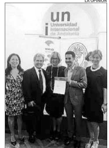
Entrega del premio.